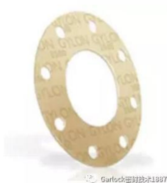
图 2: GYLON 聚四氟乙烯垫片广泛地用于液氧场合。

在严苛的介质低温工况下，我们通常推荐使用致密的改性聚四氟乙烯垫片，切割后的 PTFE 垫片也更容易清洗、不容易污染介质。