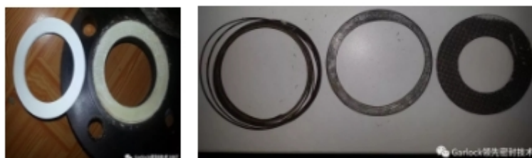
图：高温测试后 THERMA-PUR®,带云母石墨缠绕、增强石墨缠绕、石墨平垫图